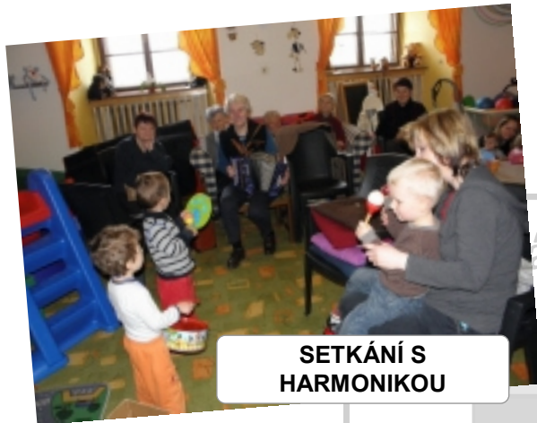
SETKÁNÍ S HARMONIKOU