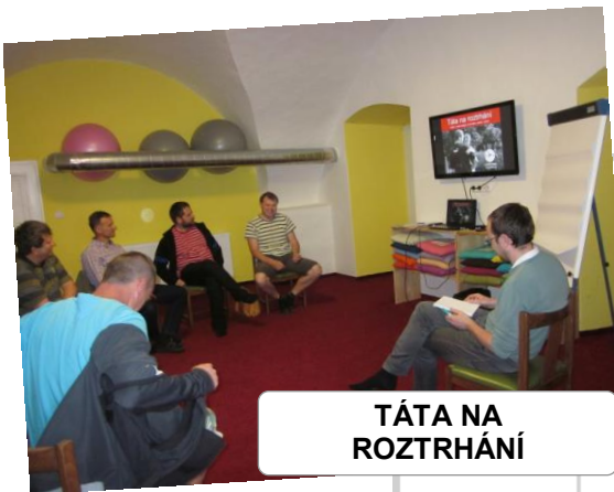
TÁTA NA ROZTRHÁNÍ