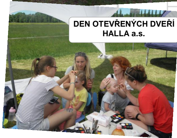
DEN OTEVŘENÝCH DVEŘÍ HALLA a.s.