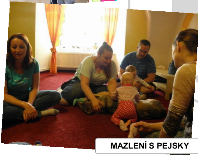
MAZLENÍ S PEJSKY