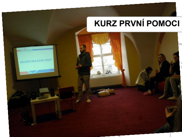
KURZ PRVNÍ POMOCI