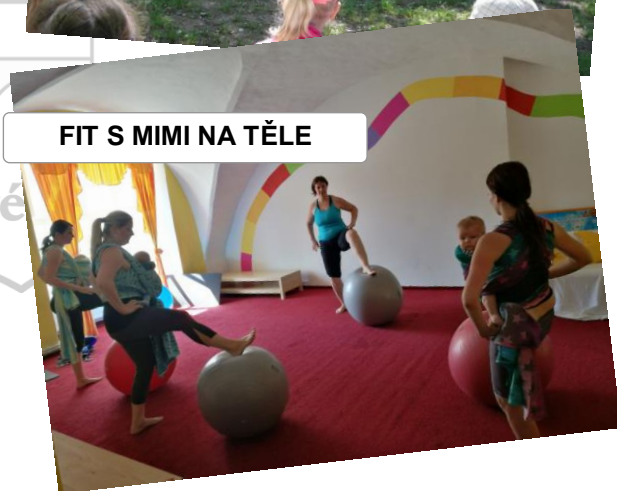
FIT S MIMI NA TĚLE